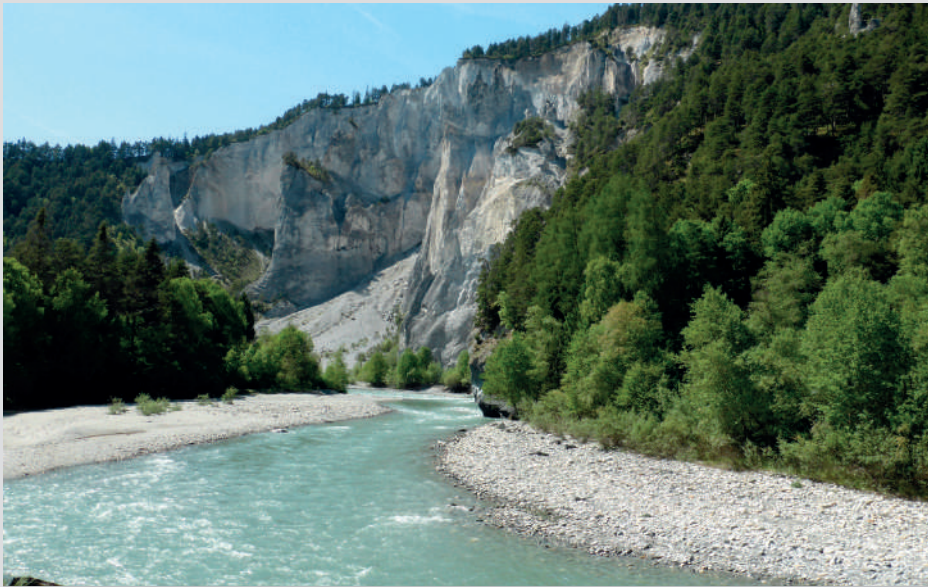
Blick in die Rheinschlucht