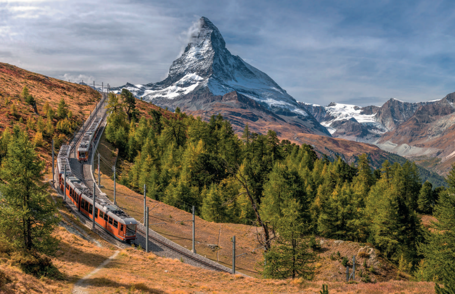
Zugbegegnung auf der Gornergratbahn mit Blick auf das Matterhorn.