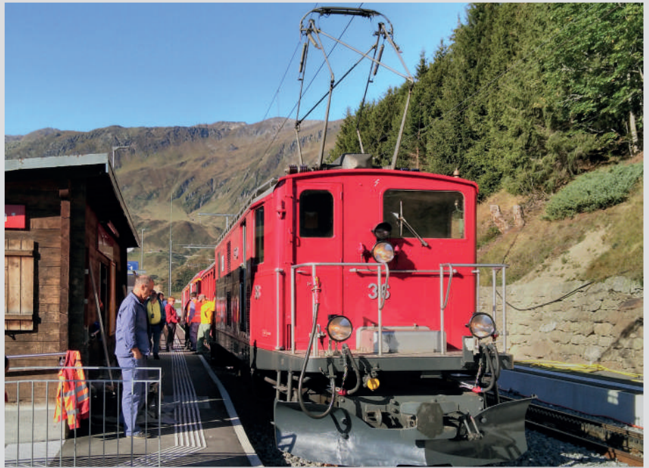
Zwischenhalt in Näschen